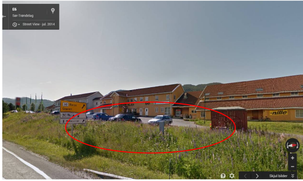
Figur 3: Viser utdrag fra google street-view, datert juli 2014. Rød, oval sirkel markerer ca. avgrensning på arealet som skal benyttes til ladestasjon.