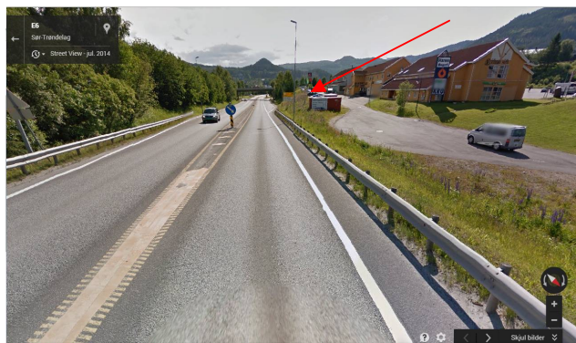
Figur 2: Viser utdrag fra google street-view, datert juli 2014. Rød pil markerer ønsket plassering av ladestasjonen.

Adkomst vil skje via dagens parkeringsplass på Prestteigen. Tiltakshaver hevder at tiltaket ikke vil medføre vesentlig endring i trafikk- og parkeringsmønsteret innenfor området.