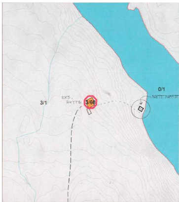
Figur 2 Fritidsbygget og det planlagte naustet.