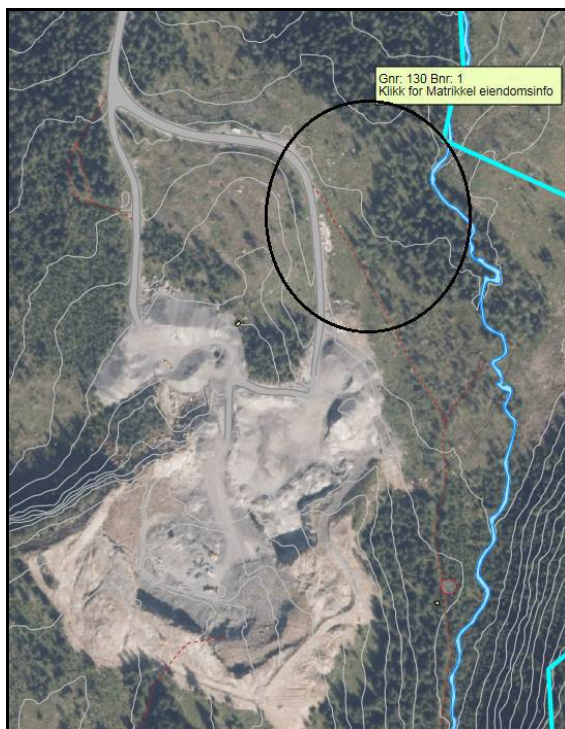
Fig 3 Ortofoto fra 2014 viser aktuelt deponeringsområdet nord for eksisterende steinbrudd (svart sirkel)

Det omsøkte området for deponiet ligger i sin helhet utenfor dagens gjeldende reguleringsplan for Solberg Steinbrudd. Dermed omfattes tiltaket av Kommuneplanens arealdel fra 2010 hvor området er avsatt til LNF(R)-formål. Tiltakshaver har startet regulering for utvidelser av steinbruddet og kommunen har fastsatt planprogrammet for Solberg steinbrudd og deponi i møte den 22.6.2015 sak 51/15.