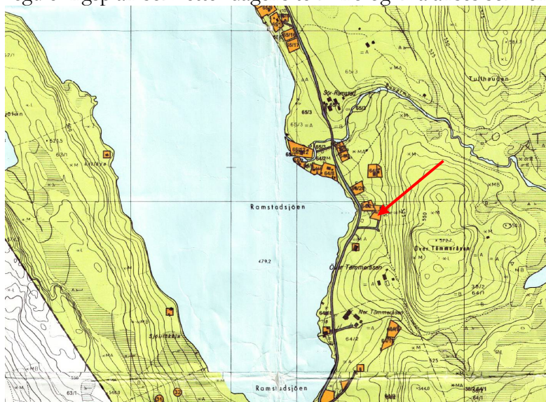
Figur 3: Utdrag fra kartet til reguleringsplan for Ramstadsjøen. Den omsøkte tomten er markert med rød pil.

Det omsøkte tiltaket ligger innenfor reguleringsplan for Ramstadsjøen. Dette er en eldre reguleringsplan som etter dagens terminologi må anses som en detaljregulering.