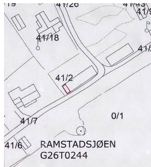
Figur 2 Situasjonskart over tiltaket.

“ Vi er en stor familie med mange barnebarn som bruker hytta både sommer som vinter. Hytta ligger et godt stykke fra sjøen, åpne i lia. Enhver utflukt til sjøen i sommerhalvåret, enten det er for å bade eller fiske, medfører mye frakt av utstyr og dermed mye uheldig trafikk.”