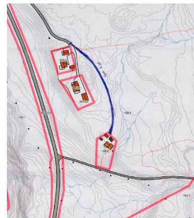
Figur 2 Situasjonskart over tiltaket.

Der det skal bygges ny veg, er det i dag en gammel naturlig vegled. Veien blir ca. 170 meter, og vil også bli benyttet til næring som blant annet skogsdrift i følge tiltakshaver.