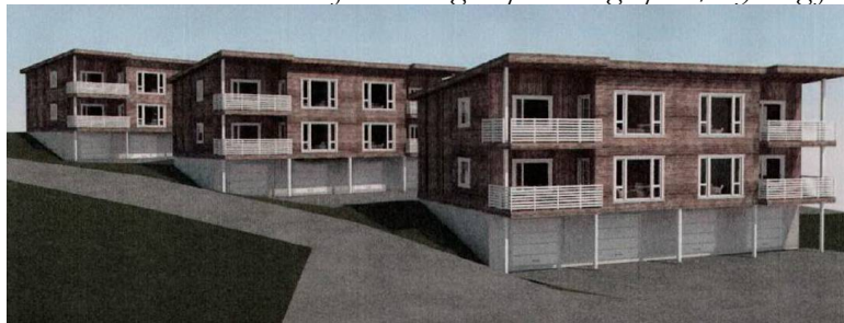
Figur 3 Tiltaket slik det ønskes gjennomført.

“ I en økende etterspørsel etter bolig/ leiligheter, ønsker vi å utnytte tomtearealet best mulig ved å se de 2 tomtene som en stor tomt. Vi står da litt friere i valg av plassering i plan/høyde og for å sette opp 3 bygg istedenfor 2 bygg.”