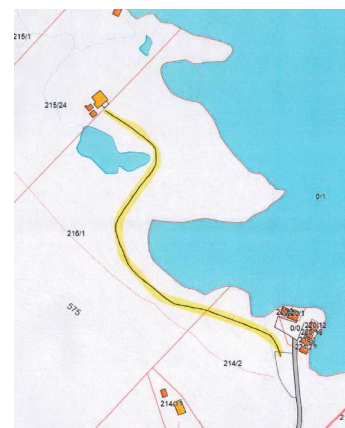
Figur 2 Situasjonskart over tiltaket.

Stien er 1,60m bred og 250m lang. Pga. grunnforholdene måtte det graves og legges grus. Etterpå ble det gruset opp."