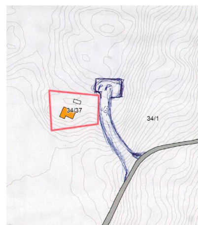
Figur 2 Situasjonskart over tiltaket.

På vedlagt situasjonskart er det inntegnet en parkeringsplass. Dette er det ikke søkt om. Denne parkeringsplassen er ca. 20m 2 .