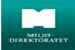
image003.jpg 2 KB