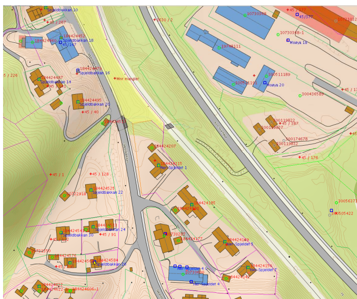
Figur 2: Situasjon i Matrikkelen etter retting

Klager er eier av arealene som vedtaket omhandler og har dermed rettslig klageinteresse i saken. Klagen er også framsatt rettidig.