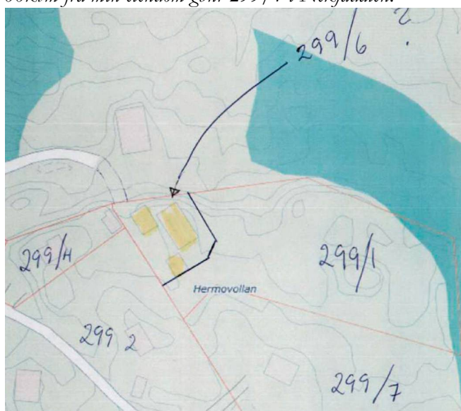
Figur 2 Situasjonskart over tiltaket.

Veirett til tomten over den allerede eksisterende vei inn på tomten (se kart).