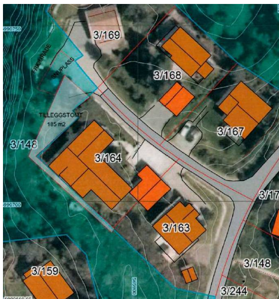
Figur 3 Situasjonskart over tiltaket.

Tiltakshaver (eier av gbnr 3/164) søker om å få erverve tilleggstomt på ca.200 m 2 fra kommunens eiendom gbnr 3/148. Eiendommen gbnr 3/164 har i dag et areal på ca. 770 m 2 . Tiltakshaver forteller at “dagens bus er på et plan og uten kjeller. Det er ønsket å utvide tomten slik at det kan de kan ordne et nytt inngangsparti og en ny garasje på oversiden av tomten, uten trapper, avsatter o.l.”