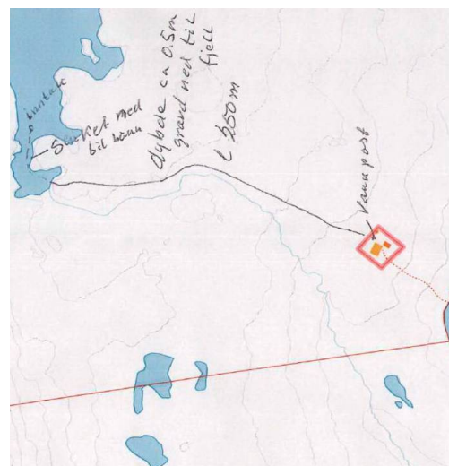
Figur 2 Situasjonskart over tiltaket.

Vannledningen har en lengde på 250m og er 0,5m dyp.